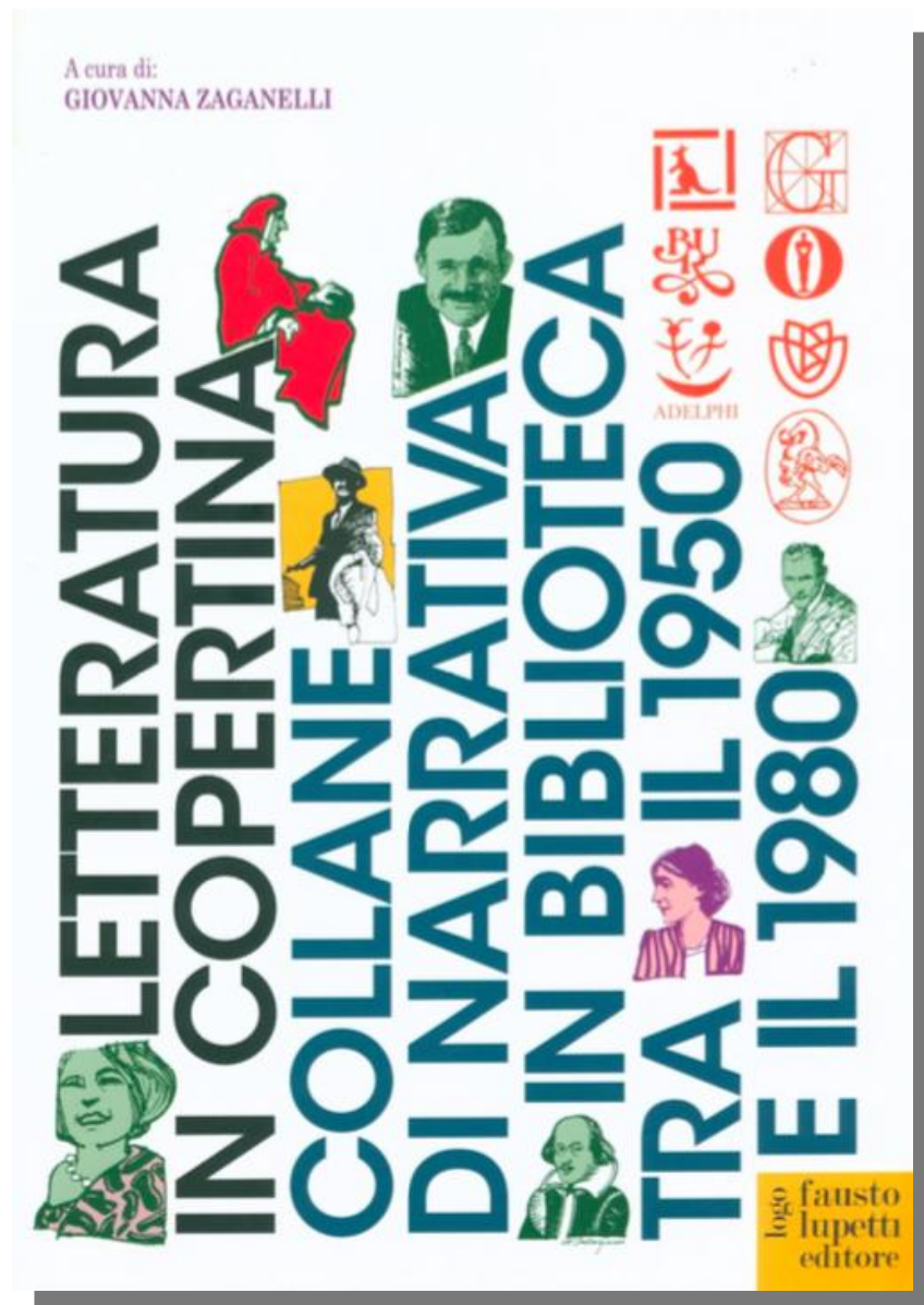
Letteratura in copertina. Copertine di collane di narrativa tra il '50 e l'80 , a cura di G. Zaganelli, Bologna, Fausto Lupetti Editore, 2013

Un ambito privilegiato di studio è rappresentato dal paratesto e in particolare dalla copertina editoriale, oggetto di una ricerca condotta dai Dottorandi; l'indagine – di natura semiotica, letteraria e iconografica – è confluita nel volume Letteratura in copertina , edito da Lupetti (2013).